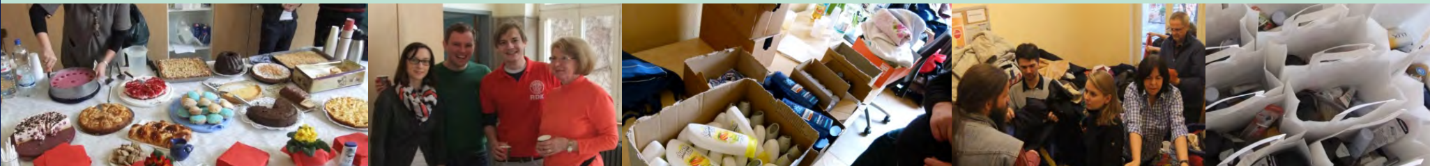
Tag der Begegnung - Ein Tag für Wohnungslose mit Ärzten, Essen- und Kleiderausgabe, etc.