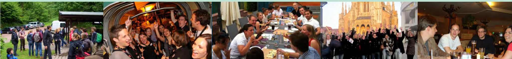
Freundschaft - Straßenbahnparty, Schwarzwaldwochenende, gemeinsam Zeit verbringen, ect.