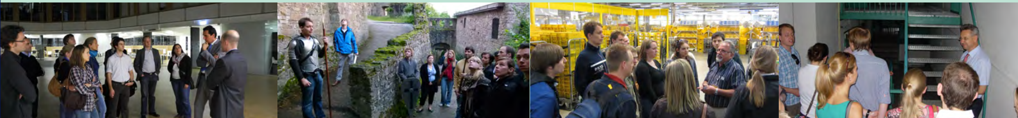
Besichtigungen und Vorträge - Firmen, Kulturdenkmäler, Präsentationen und vieles mehr