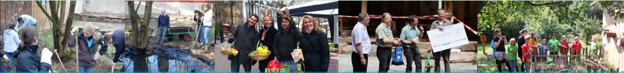
Waldklassenzimmer - Mitbauen, Spenden sammeln, Kindern den Wald zeigen