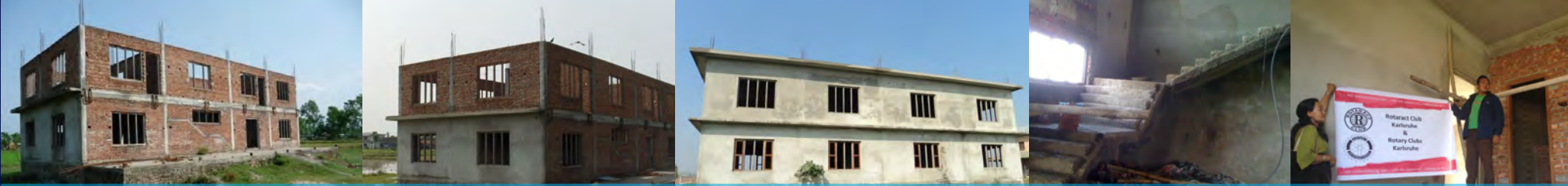
Ambulatorium Nepal - Ein Krankenhaus für 7000 Menschen